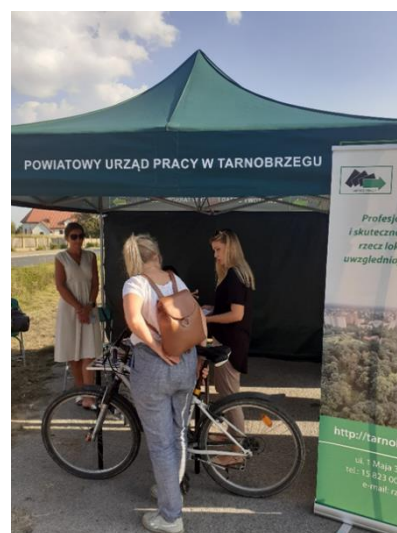
Mobilny Punkt Informacyjny

Wrzesień 2023 roku poświęciliśmy działaniom informacyjnym mającym na celu dotarcie z ofertą do osób młodych, również biernych zawodowo, niezarejestrowanych w PUP. Działania te objęły dystrybucję ulotek w miejscach użyteczności publicznej w każdej gminie i szkołach ponadpodstawowych, umiejscowienie banerów w sołectwach, reklamę radiową w formie audycji i spotów reklamowych atrakcyjnie przedstawiających korzyści uczestnictwa w projekcie, prowadzeniu Facebooka dedykowanego projektowi „ Punkt w punkt ” oraz akcji promocyjnej w formie Mobilnych Punktów Informacyjnych (MPI). Przez 20 dni roboczych, w godz. popołudniowych tj. 15.00-17.00, odwiedziliśmy 20 miejscowości. Oprócz dyżuru pracowników pod namiotem w tym samym czasie działała również mobilna reklama dźwiękowa.