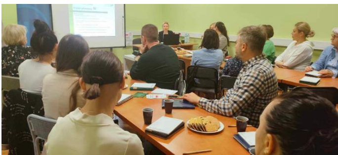
Działalność punktu zaprezentowano także na Dniach Pracodawców oraz podczas Grupowych Informacji Zawodowych z ostatnimi klasami szkół ponadpodstawowych.

godziny pracy min. do rozkładu jazdy dostępnych środków transportu publicznego, pobytu dziecka w przedszkolu, czy też pozostawienia dziecka pod opieką osób trzecich. Indywidualne podejście pozwoli na pogodzenie ról społecznych z możliwością wejścia lub powrotu na rynek pracy. Staż rozliczany będzie godzinowo, przy założeniu, że stawka za 1 godzinę wynosić będzie brutto 23,50zł. Z inicjatywy i za zgodą pracodawcy, uczestnik stażu będzie miał możliwość równoległego odbywania stażu oraz uczęszczania na zajęcia szkoleniowe. Efektem nowego modelu stażu, ma być zatrudnienie, w tym celu przewidziano zachętę dla pracodawcy w postaci refundacji składek ubezpieczenia społecznego za zatrudnienie stażysty po okresie odbytego stażu przez okres od 1 do 3 miesięcy.