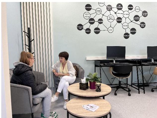
Indywidualna porada zawodowa

W punkcie osoby młode mogą skorzystać z pomocy w zakresie: