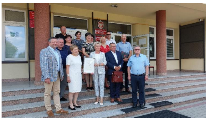
Uroczyste podpisanie umów o partnerstwie odbyło się 23 sierpnia 2023 roku

Działania projektowe rozpoczęliśmy 1 sierpnia 2023 roku. Zaplanowaliśmy utworzenie na terenie Powiatowego Urzędu Pracy w Tarnobrzegu Punktu Doradztwa dla Młodzieży (PDM) czynnego od poniedziałku do piątku oraz 4 punktów doradczych w 4 gminach czynnych po 2 dni w tygodniu. Ułatwi to dotarcie do osób młodych do 30 r.ż. i objęcie ich kompleksowym doradztwem oraz zintegrowanymi usługami na zasadzie jednego okienka one stop shop .