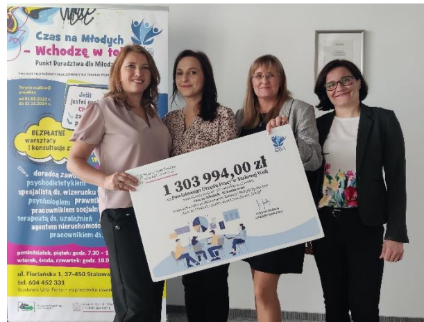
Punkt Doradztwa dla Młodzieży - Doradcy Zawodowi