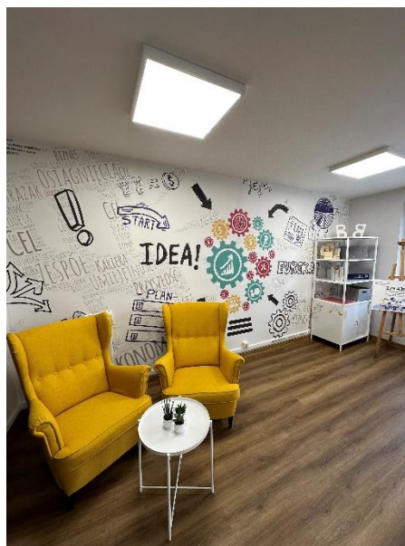
Punkt Doradztwa dla Młodzieży

Równowaga pomiędzy życiem zawodowym a prywatnym jest jednym z głównych warunków zachowania zdrowia, dobrego samopoczucia jak również satysfakcji z życia i pracy. W ramach projektu pilotażowego, uczestnicy projektu będą mieli szanse na podjęcie aktywności zawodowej – innowacyjnego stażu dla młodych