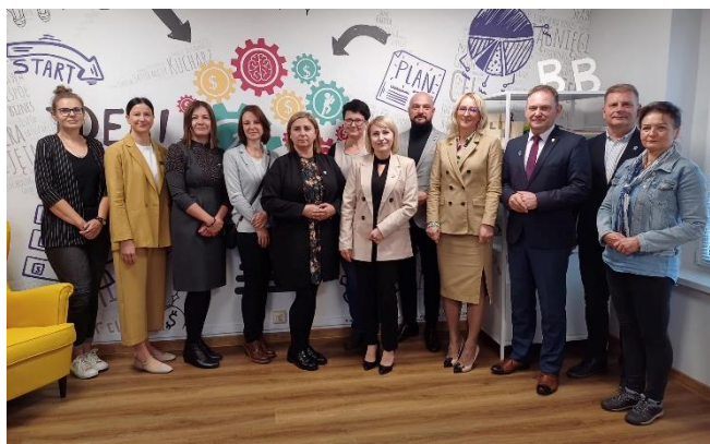
Otwarcie Punktu Doradztwa dla Młodzieży

Punkt powstał w ramach projektu „ Akcja – Reakcja! Nowa Generacja ” realizowanego przez Powiatowy Urząd Pracy w Pszczynie w ramach naboru na projekty pilotażowe „ Czas na Młodych - punkty doradztwa dla młodzieży ” organizowanego przez Ministerstwo Rodziny, Pracy i Polityki Społecznej, a finansowanego ze środków Funduszu Pracy.