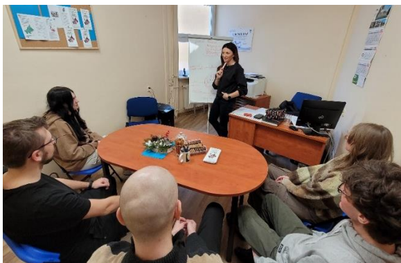
Konsultacje ze specjalistami

Zainteresowaniem cieszą się konsultacje indywidualne ze specjalistami oraz możliwość udziału w spotkaniach grupowych. Przykładowe tematy: „Pierwsza praca. Prawo pracy – aspekty praktyczne” (doradztwo prawne); „Budowanie poczucia wartości i pewności siebie” (doradztwo psychologiczne), „Czy wiesz co jesz?” ( happening z zakresu doradztwa w zakresie zdrowia i profilaktyki zdrowotnej).