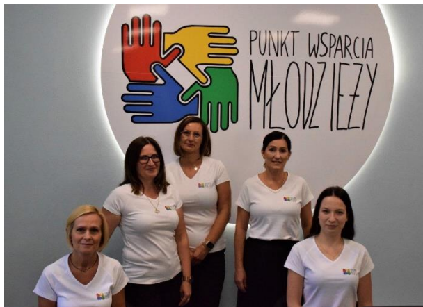
Pracownicy Punktu Wsparcia Młodzieży

którego głównymi odbiorcami są ludzie młodzi. Tekst utworu zwraca uwagę na problemy społeczne młodzieży, prezentuje dostępne w PWM usługi oraz zaprasza do punktu. Utwór reklamuje Punkt Wsparcia Młodzieży w radio, na Facebooku oraz będzie wykorzystany podczas krótkiego filmu reklamowego, który jest w przygotowaniu.