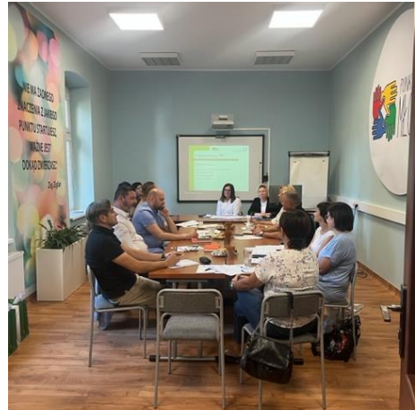
Spotkanie z partnerami

W realizację projektu zaangażowani zostaną także lokalni pracodawcy, u których testowany będzie nowy model odbywania stażu, zakładający elastyczny wymiar godzin stażu w poszczególnych dniach miesiąca jak i w miesiącu. Taka organizacja stażu pozwoli dostosować