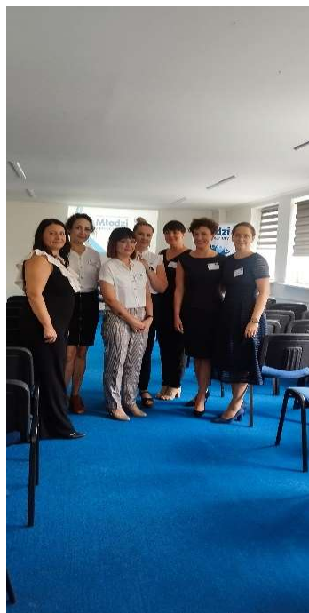
Pracownicy zaangażowani w projekt