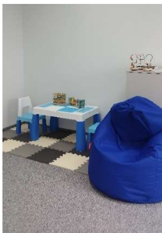
Kącik dla dzieci

Dla młodych rodziców stworzyliśmy ułatwienie kontaktu z nami poprzez kącik dla dzieci, aby można było porozmawiać bez stresu o pociechy.