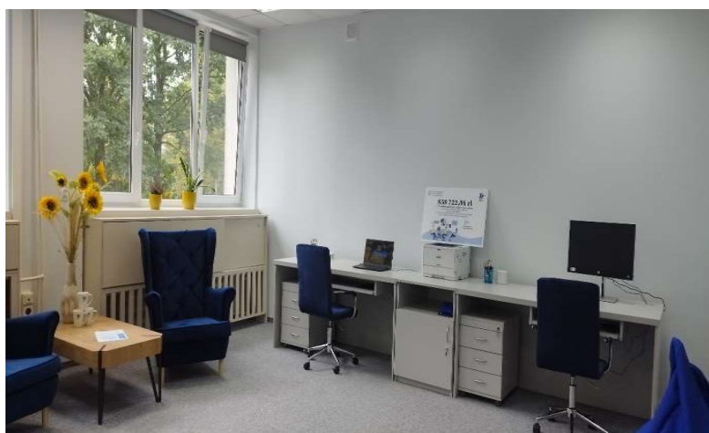
Stacjonarny punkt doradztwa dla młodzieży

Aby dotrzeć z pomocą do jak największej ilości osób ruszamy z punktem mobilnym, który będzie mieścić się w Gminach Powiatu Augustowskiego, dwóch Szkołach Ponadpodstawowych. Nasza mobilność przewidziana jest także na różnych okolicznych imprezach, gdzie będziemy mogli się spotkać i porozmawiać na nurtujące problemy osób młodych borykających się ze znalezieniem pracy.